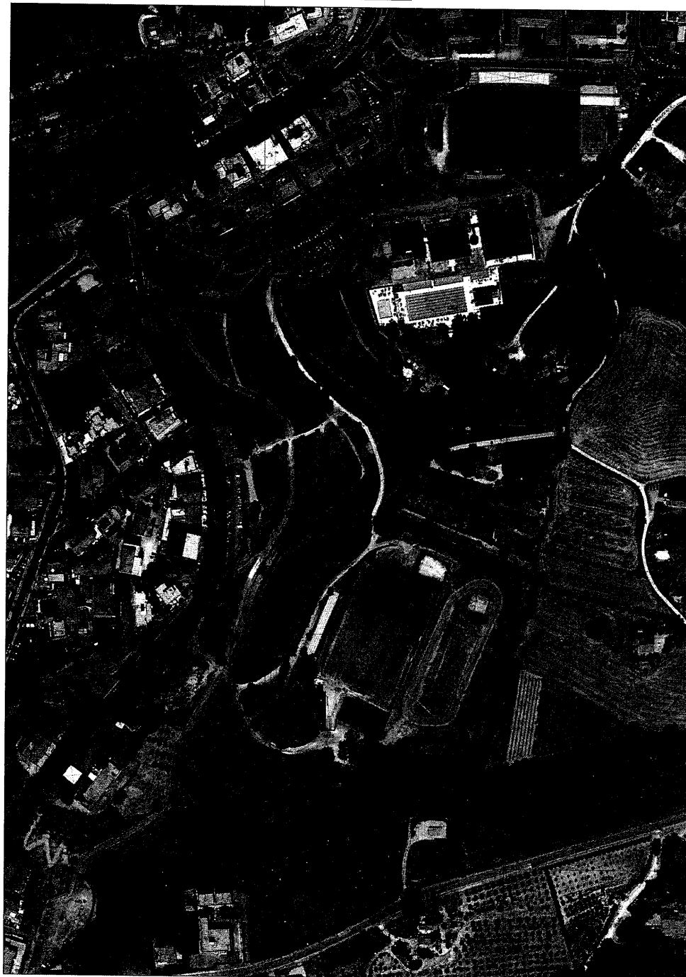
Stato Attuale: foto aerea con individuazione del comparto