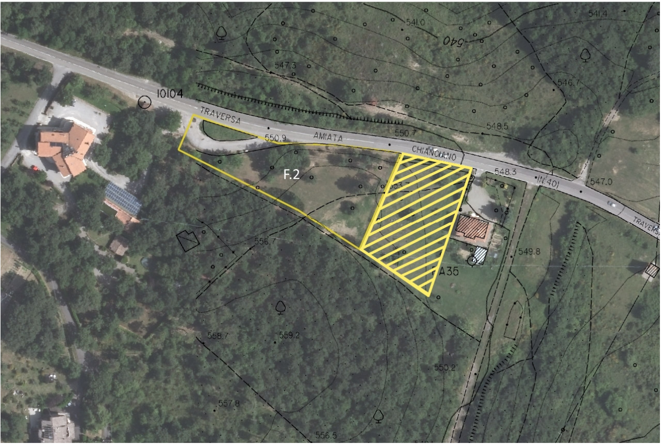
Stato Attuale: foto aerea con individuazione del comparto