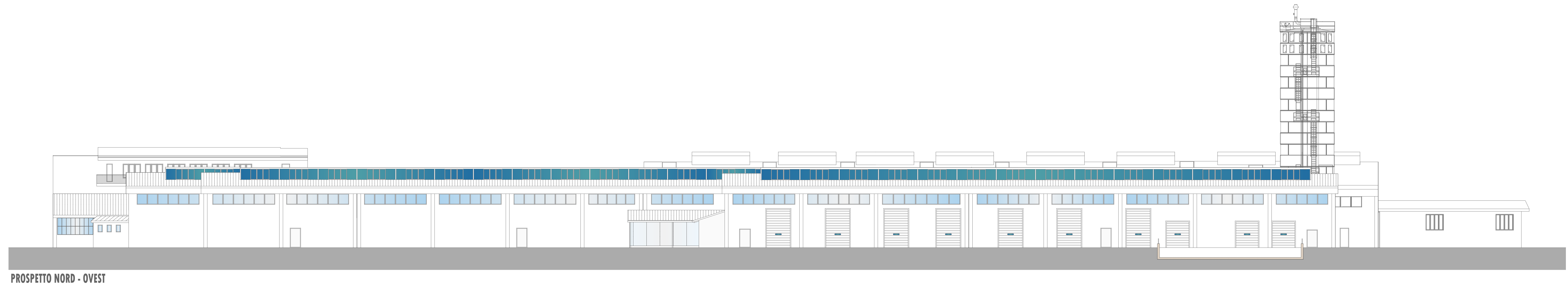
PROSPETTO NORD - OVEST