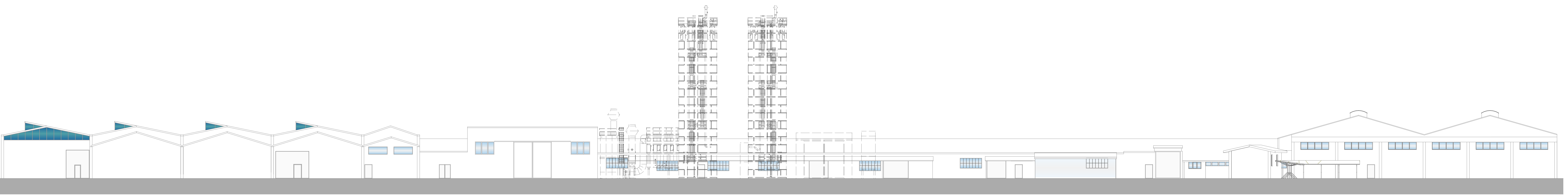
PROSPETTO SUD - OVEST